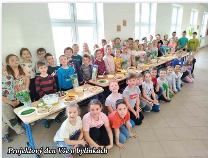
Projektový den Vše o bylinkách