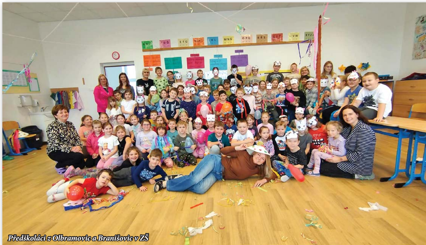
Předškoláci z Olbramovic a Braníšovic v ZŠ