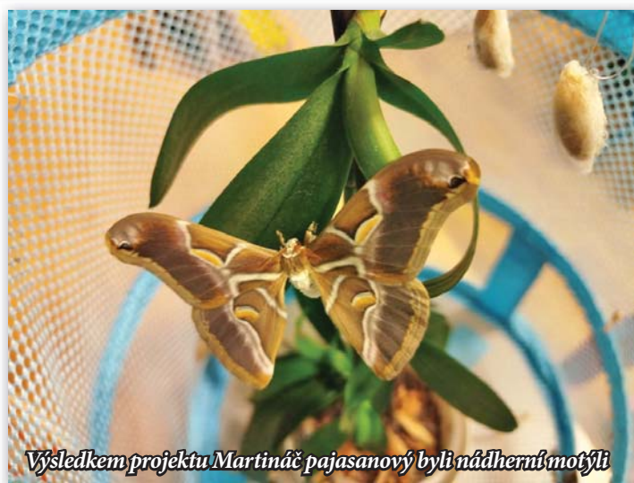
Výsledkem projektu Martináč pajasanový byli nádherní motýli