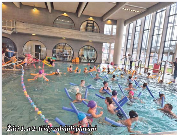
Žáci 1. a 2. třídy zahájili plavání