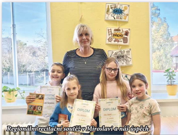
Regionální recitační soutěž v Miroslavi a náš úspěch