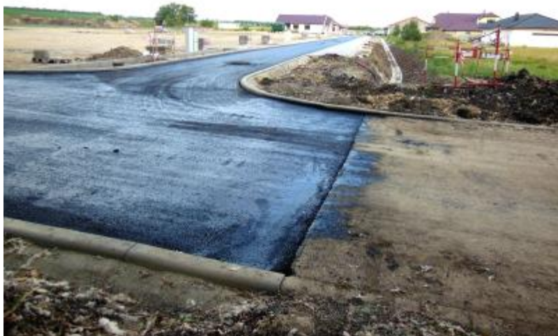
Výstavba inženýrských sítí za MŠ

Také v minulém vydání zpravodaje jsem vás informoval o tom, že městyse Olbramovice podal žádost o finanční podporu na výstavbu sběrného dvora odpadů v Olbramovicích. Naše žádost byla úspěšná a obdrželi jsme od Státního fondu životního prostředí rozhodnutí o poskytnutí dotace ve výši 4.7 mil korun uznatelných nákladů. Věříme, že sběrný dvůr v Olbramovicích všichni přivítáte a městyse vám tím usnadní problém s ekologickou likvidací nepotřebných věcí a předmětů v průběhu celého roku. Se stavbou sběrného dvora by se mohlo začít ještě v letošním roce. Sběrný dvůr odpadů bude stát před pěsti-