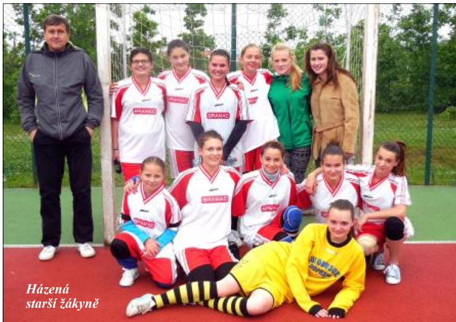
Házená starší žákyně