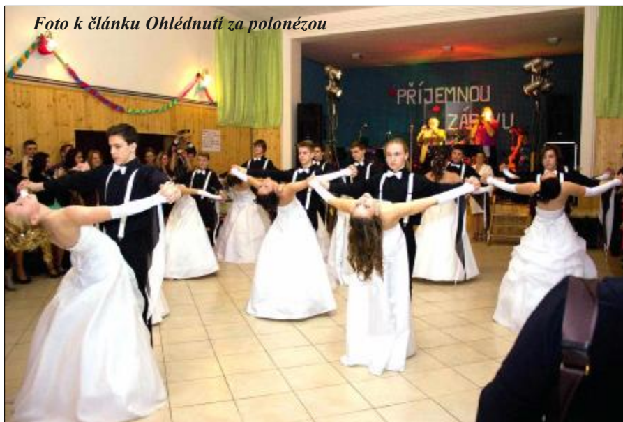
Foto k článku Ohlédnutí za polonézou

Zastupitelstvo městyse Olbramovice přeje všem našim spoluobčanům pěkné prožití velikonočních svátků, bohatou pomlázku a hodně zdraví v nejkrásnějších měsících roku.